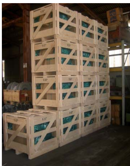
Les harasses (caisse à claire-voie)