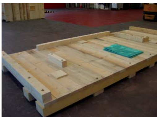
Fond de caisse spéciale