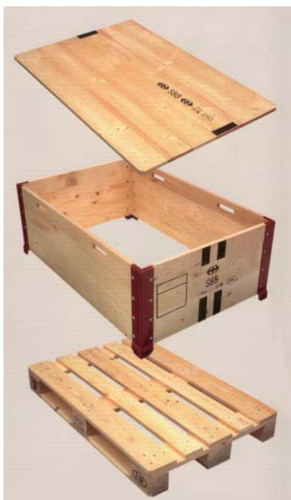
Palettes - cadres - couvercles

Depuis plus de 100 ans, nous fabriquons des caisses pour l'industrie Suisse