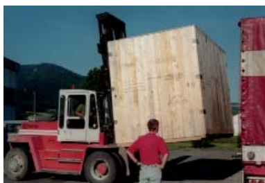
Chargement & transport